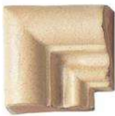
CORNICE FRAME CORNER