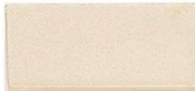
STAIR TREAD / SINK CAP 4" X 8" / 105 X 215 mm