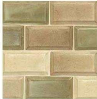
BATCHELDER BEVELLED BRICK 3" X 6" / 76 X 160 mm