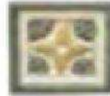
TARIFA DOT 2" / 50mm