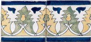
MARBELLA BORDER 4" / 105 mm