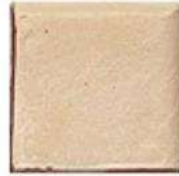
DOUBLE BULLNOSE 4" / 105 mm