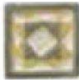
CUEVAS DOT 2" / 50mm