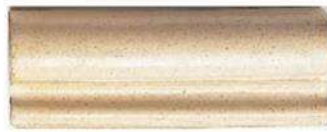
CORNICE MOLDING 2 1/2" X 5 3/4" / 63 X 146 mm