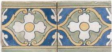
MADRID BORDER 4" / 105 mm