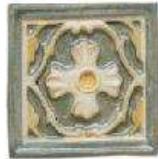
ALAMEDILLA DECO 4" / 105 mm