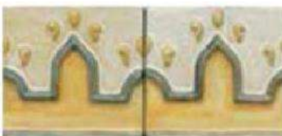
CHAPARRAL BORDER 4" / 105 mm