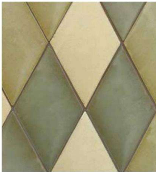
MONTECITO BLEND RHOMBOID