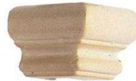
CORNICE OUTSIDE CORNER