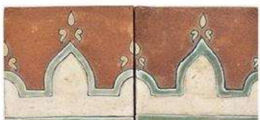
SAN VICENTE BORDER 4" / 105 mm