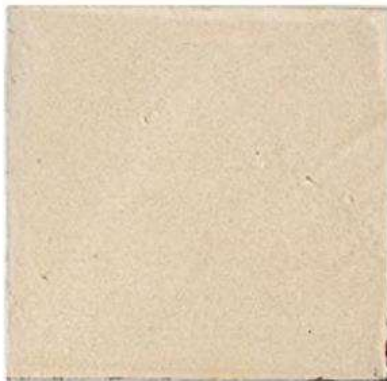
FIELD TILE 8" / 215 mm