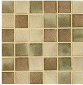
BATCHELDER BLEND MOSAIC 2" / 55 mm