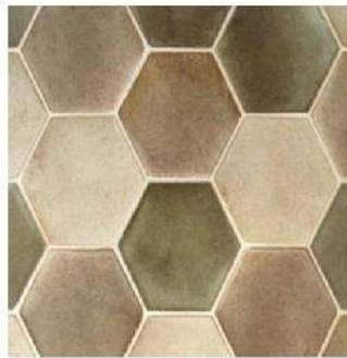
BATCHELDER BLEND HEXAGON 6" / 160 mm