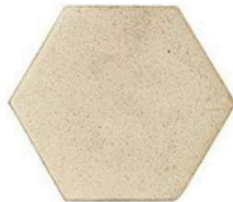
HEXAGON 6" / 160 mm