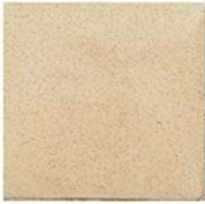
FIELD TILE 6" / 160 mm