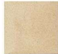
FIELD TILE 4" / 105 mm