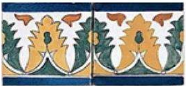
ALGIERS BORDER 4" / 105 mm