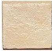
BULLNOSE 4" / 105 mm