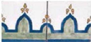
MOORISH BORDER 4" / 105 mm