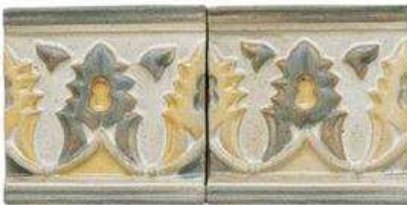
AGADIR BORDER 4" / 105 mm