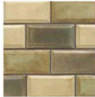
MONTECITO BEVELLED BRICK 3" X 6" / 76 X 160 mm