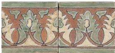
TANGIERS BORDER 4" / 105 mm