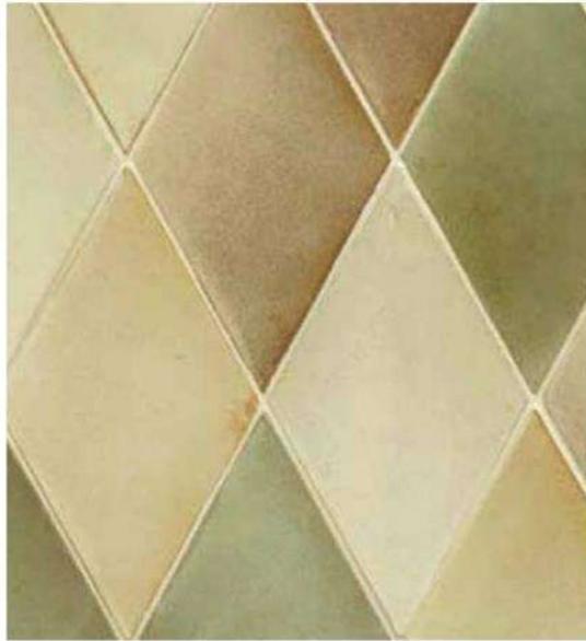
BATCHELDER BLEND RHOMBOID