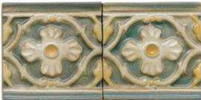
ALAMEDILLA BORDER 4" / 105 mm