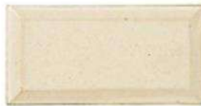
BEVELLED BRICK 3" x 6" / 76 x 160 mm