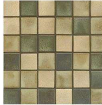
MONTECITO BLEND MOSAIC 2" / 55 mm