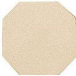
OCTAGON 6" / 160 mm