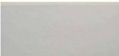
BULLNOSE LONG 6 X 12" / 152 X 305 mm