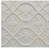
ALHAMBRA 6" / 152 mm