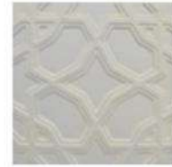
ALCAZAR 6" / 152 mm