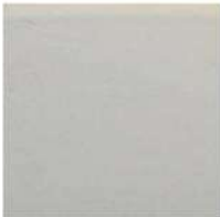
BULLNOSE 6" / 152 mm