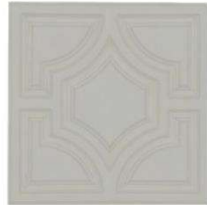
PUERTA 10" / 254 mm