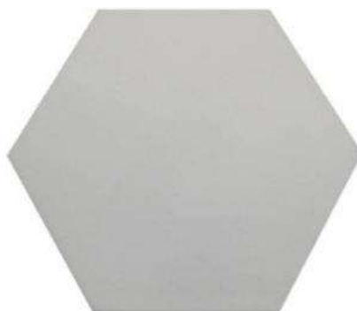
HEXAGON FIELD TILE 10" / 254 mm