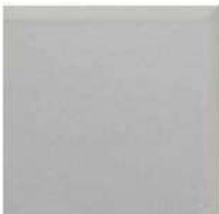
DOUBLE BULLNOSE 6" / 152 mm