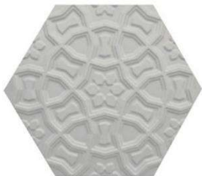
MARRAKECH 10" / 254 mm