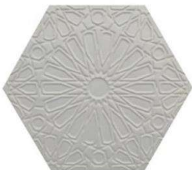
FEZ 10" / 254 mm