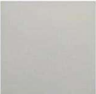
FIELD TILE 6" / 152 mm