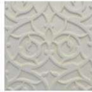
MEZQUITA 6" / 152 mm