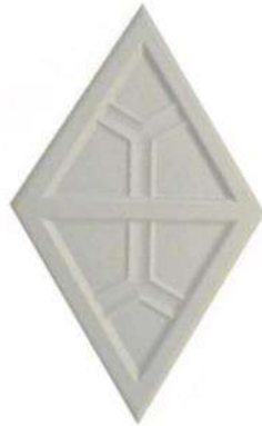
SAN MIGUEL 6 X 10" / 152 X 254 mm