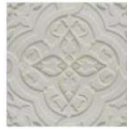
SEVILLA 6" / 152 mm