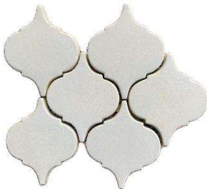
ARABESQUE MOSAIC 6" / 152 mm